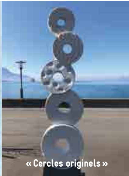
« Cercles originels »