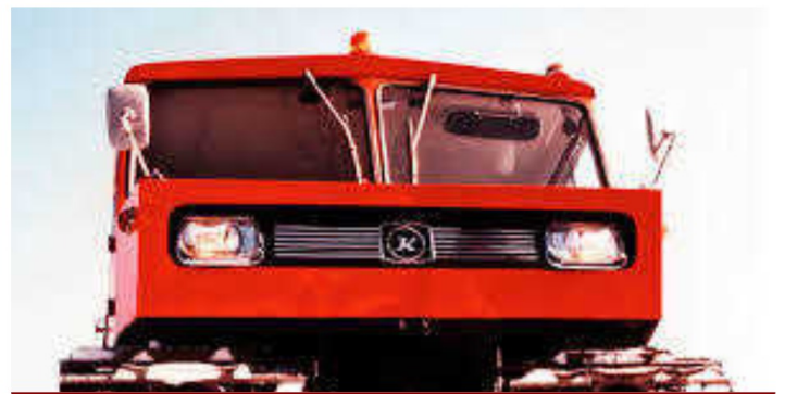
Premier prototype de Kässbohrer en 1967