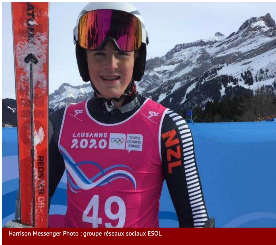
Harrison Messenger Photo : groupe réseaux sociaux ESOL