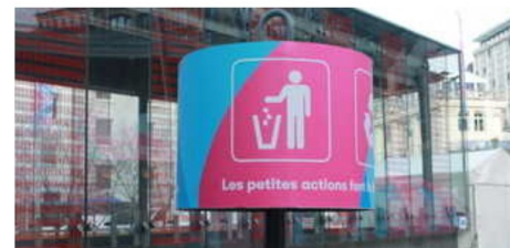
Une des nombreuses poubelles réparties dans toute la ville de Lausanne

Pour ces Jeux olympiques de la Jeunesse qui se déroulent dans de nombreuses stations, plusieurs structures ont été soit rénovées, soit réutilisées, soit encore construites pour accueillir ultérieurement de jeunes étudiants comme le Vortex. Ce bâtiment reste quelque chose de réutilisable car après les JOJ, il sera loué pour les jeunes étudiants lausannois et les hôtes académiques. Le Vortex est pourvu de 1200 panneaux solaires qui serviront à alimenter une partie du bâtiment et des