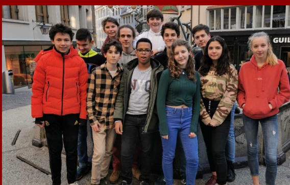
La rédaction de l'EPS Corsier de gauche à droite: