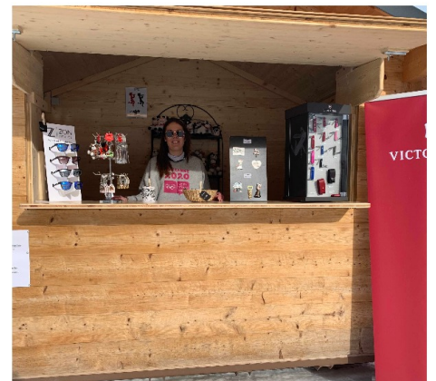
Le chalet du Bazar des Alpes en bas des pistes.

Bien sûr, les infrastructures sont opérationnelles à présent. Il faudrait certes envisager quelques aménagements, mais ça serait super de pouvoir accueillir les Jeux olympiques adultes.