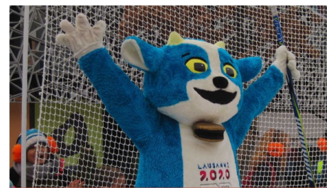
Yodli, la fameuse mascotte des JOJ

imaginée par les étudiants de l'Ecole romande d'arts et communication (Eracom). Tous les projets ont été mis au vote une première fois auprès des élèves de Lausanne et alentours puis auprès des jeunes athlètes suisses. Yodli: un nom qui nous fait penser à notre fameux Yodel que nous aimons tant. Ses couleurs multiples comme le bleu, le gris, le jaune, n'ont pas été choisies au hasard; oui, tout a un rapport avec la Suisse, bien évidemment. La nature suisse a inspiré le bleu et le blanc, tandis que le jaune