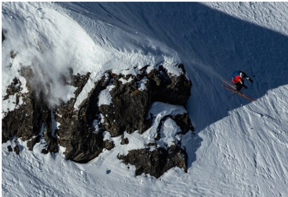
Quand est-ce que le Freeride franchira la porte des JO?