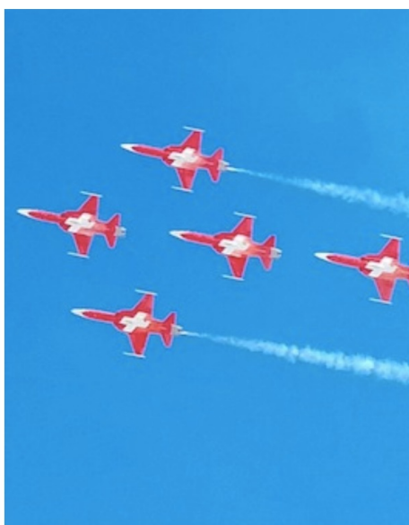
Cinq avions de la patrouille au-dessus des Diablerets.

Samedi dernier, la patrouille suisse a présenté une magnifique chorégraphie aérienne d'une dizaine de minutes, au-dessus du village des Diablerets, seul site hôte des JOJ à les avoir accueillis pendant la durée des Jeux. Les avions de chasse blanc et rouge ont passé à moins de quinze mètres du sol entre la compétition du Super combiné masculin et celle du Super combiné féminin, sous un ciel bleu et un soleil éclatant. Un entraînement avait eu lieu le vendredi. Le vacarme qu'ils ont produit a pu effrayer les plus petits mais en a émerveillés plus d'un.