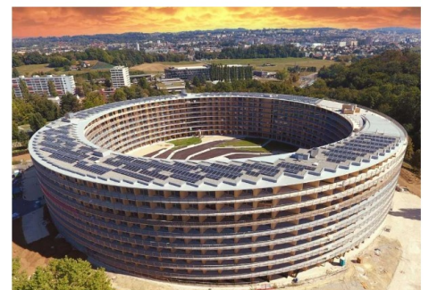
Il a fallu 29 mois pour construire le Vortex.