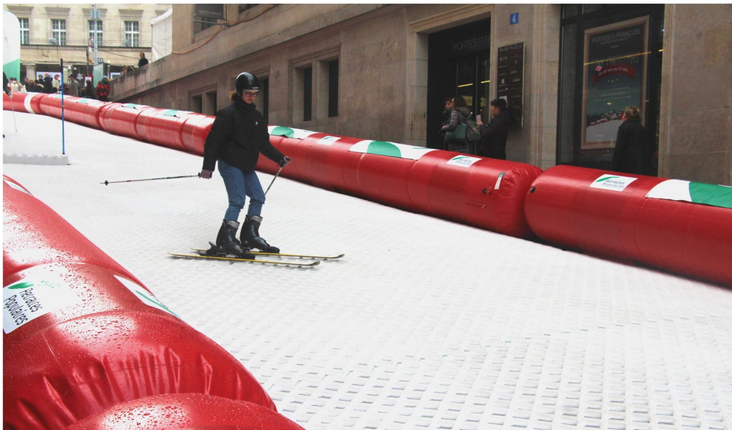
Des skieurs urbains envahissent le centre de la ville de Lausanne.