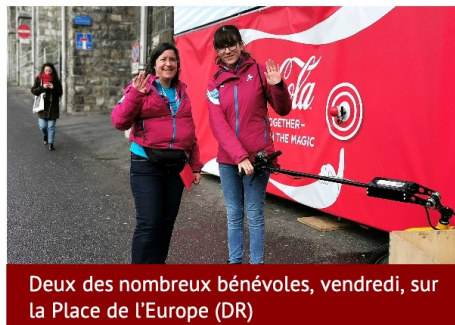
Deux des nombreux bénévoles, vendredi, sur la Place de l'Europe