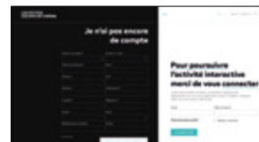
Connexion ou création du compte