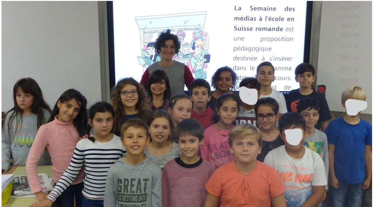
Les 6H d'Ardon