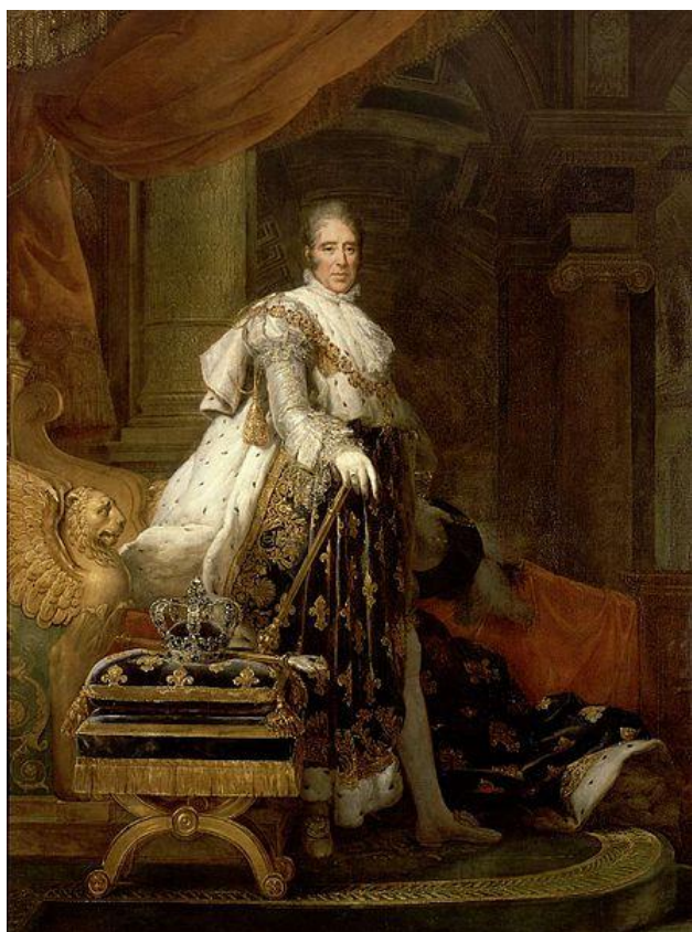
Portrait de Charles X par François Gérard 1825.