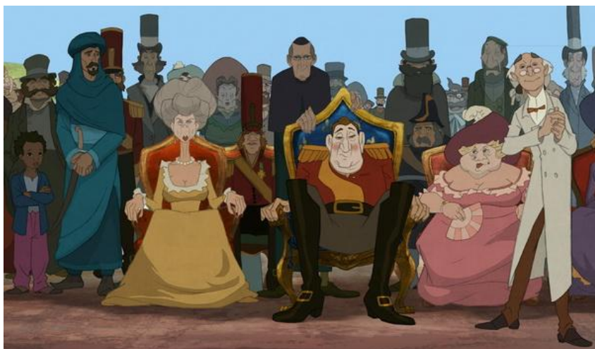
Illustration tirée du film "Zarafa"

Comparer la représentation du roi Charles X dans les deux images suivantes.