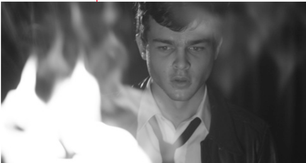
La lumière qui éclaire et la lumière qui aveugle

Tetro et Bennie correspondent en tout point à cette définition, puisqu'ils sont les héros tragi-