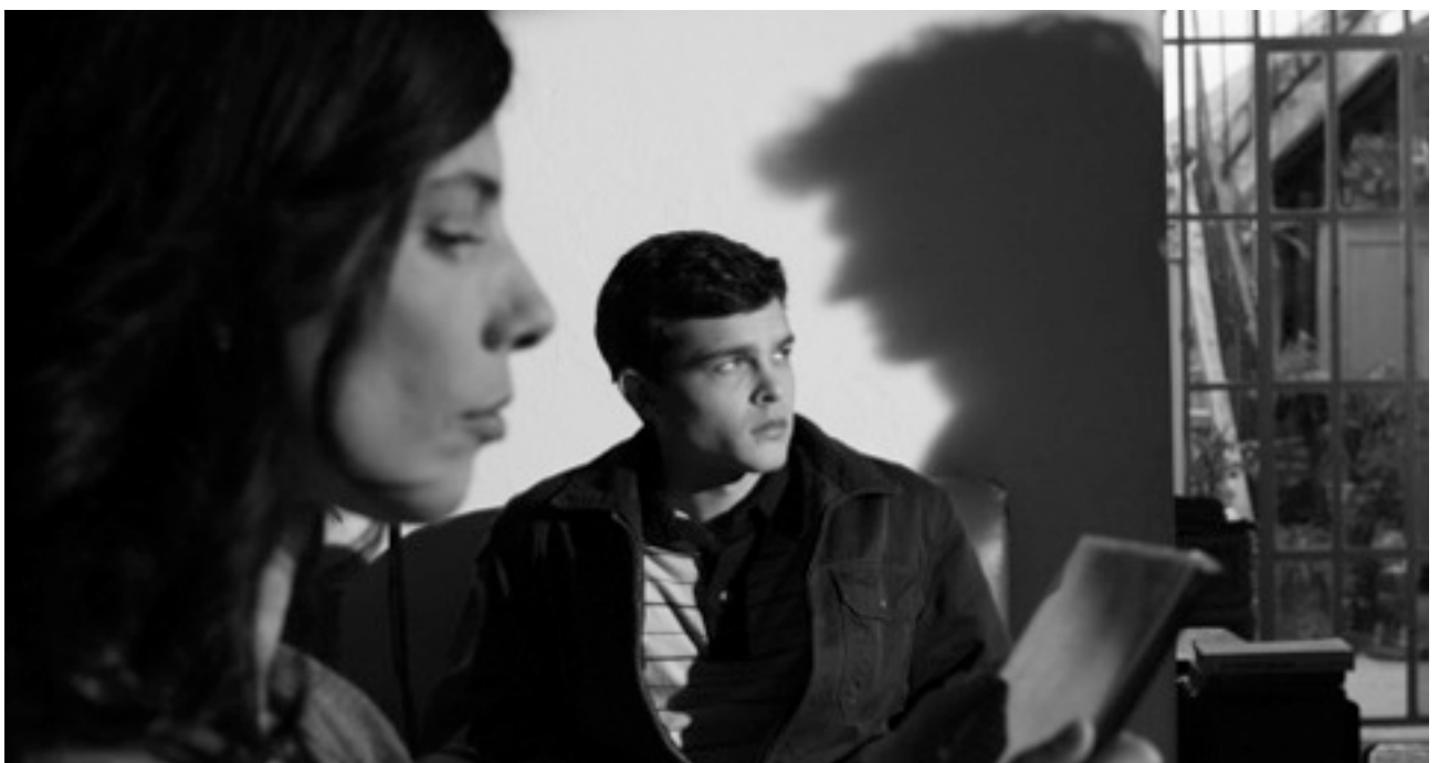
Question de vision, question de regard

Tetro a cru obtenir le bonheur en échange d'aliénations désastreuses dont il n'a pas perçu l'importance : renier sa famille, haïr à jamais, mentir à tous, y compris à soi-même, etc.