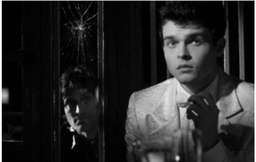
L'ombre d'un miroir se reflète-t-elle?