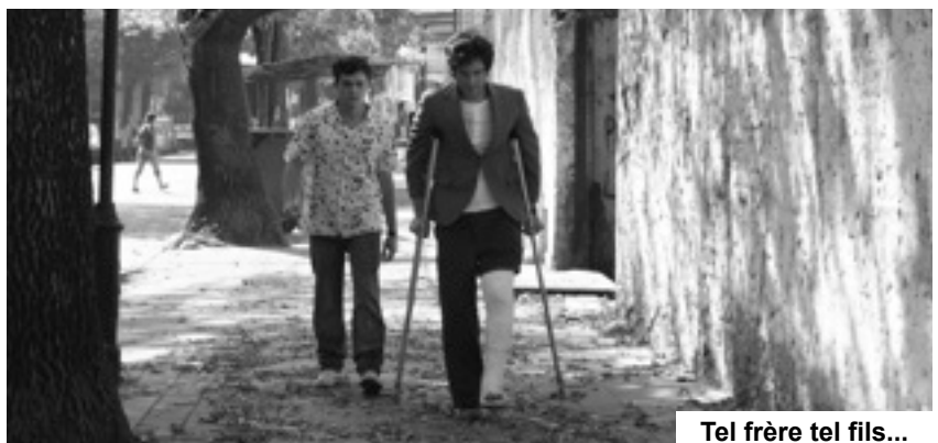
Tel frère tel fils...