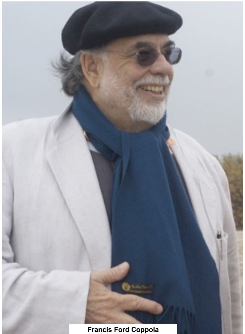
Francis Ford Coppola