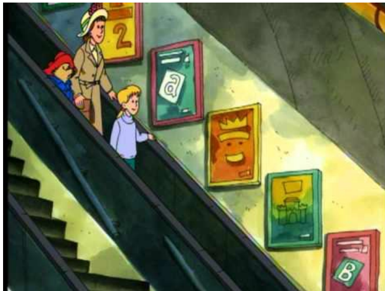
Episode de "Paddington goes underground", disponible sur sur Youtube

Les enfants étaient très angoissés la première fois que je leur ai proposé de leur montrer un épisode du dessin animé de Paddington Bear en anglais. Pourtant, ils ont vu qu'ils pouvaient comprendre le sens général d'un message, grâce aux images, aux intonations et à quelques mots connus. C'est une compétence essentielle dans l'apprentissage des LVE.