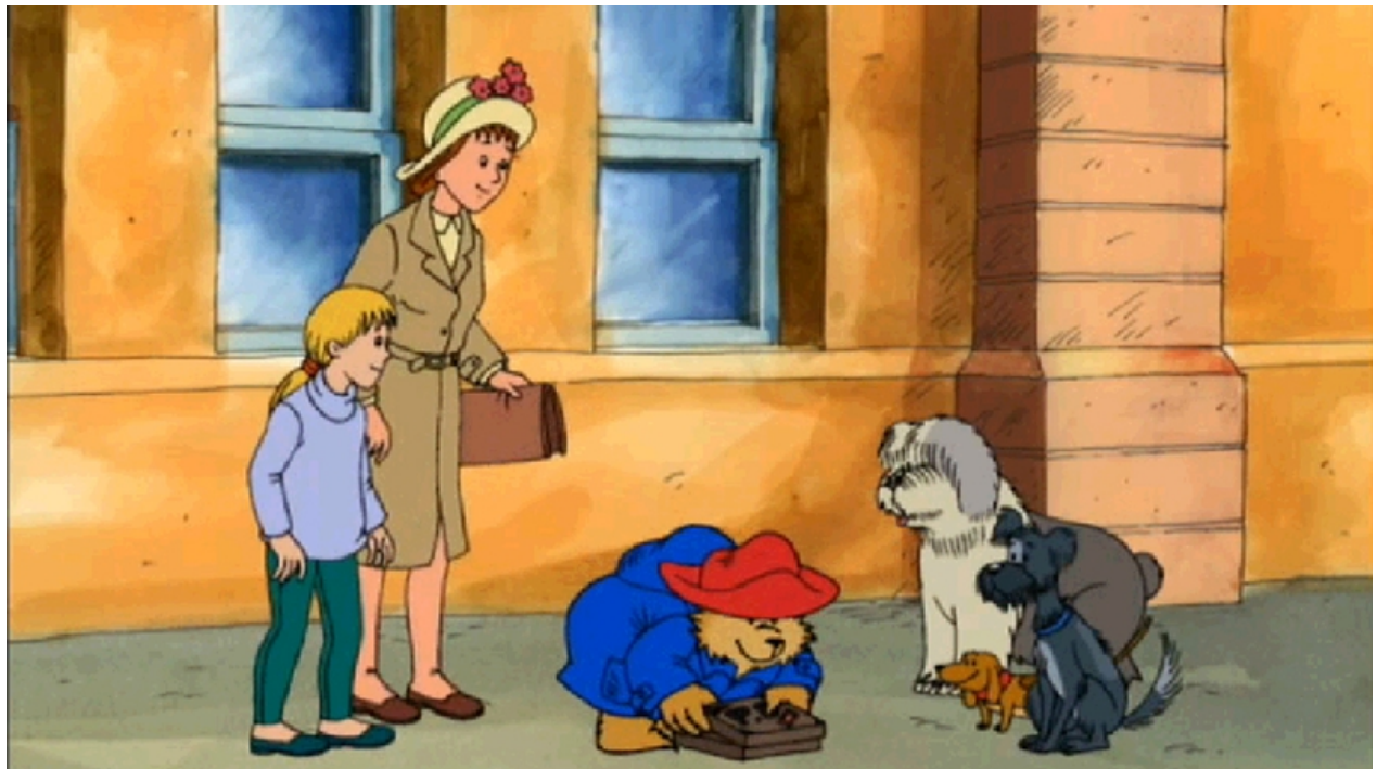
Episode de "Paddington goes underground", disponible sur sur Youtube

Quant à moi, je vous assure que je ne regarderai plus les stations de métro dans les rues de Londres de la même façon ! Ils sont doués mes p'tits élèves !