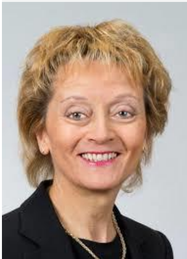
Eveline Widmer-Schlumpf en 2012