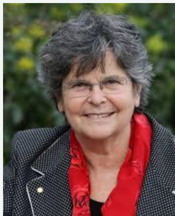
Ruth Dreifuss en 1999