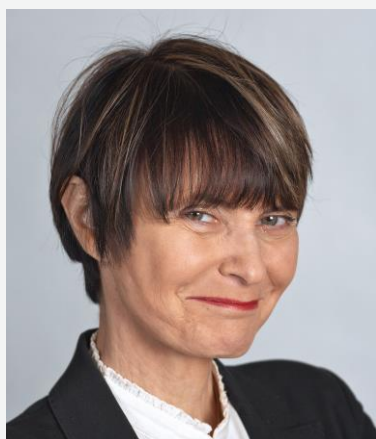
Micheline Calmy-Rey en 2007