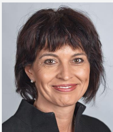
Doris Leuthard en 2010 et 2017