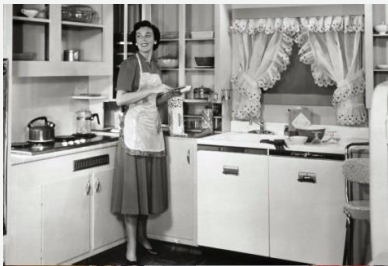
En mai 2011, un article de fr.myeurop.info

dénonçait une forte tendance parmi les Autrichiennes (1 sur 2) à souhaiter être femme au foyer, dans la tradition KKK (Kinder – Küche – Kirche) !