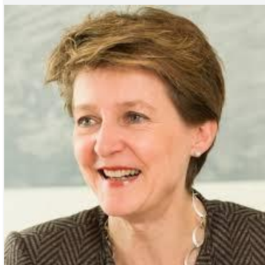
Simonetta Sommaruga en 2015