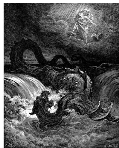
La destruction du Léviathan dans La Bible illustrée de Gustave Doré (1865)

Le titre – Le Léviathan est un monstre marin qu'il vaut mieux éviter de contrarier. Cette créature effrayante est souvent évoquée dans la Bible (Livre de Job, Psaumes, Apocalypse). On trouve son origine dans la mythologie phénicienne qui en fait le monstre du chaos primitif.