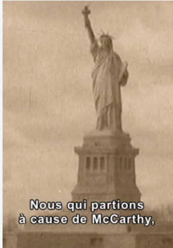
Nous qui partions à cause de McCarthy,