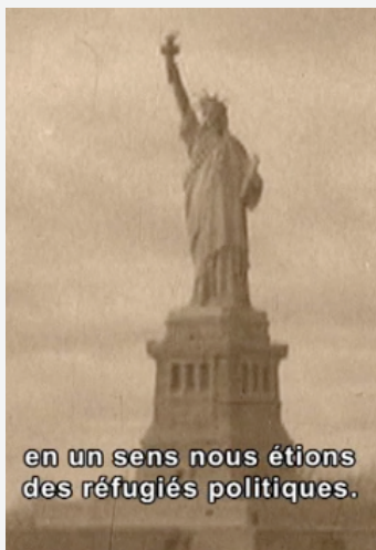
en un sens nous étions des réfugiés politiques.