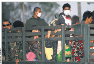
Les Hmongs ont été reconduits au Laos par camions, malgré les protestations de la communauté internationale.

Originaires des régions montagneuses du sud de la Chine, les Hmongs se sont installés au Laos au début du XIXe siècle, où ils ont vécu paisiblement jusque dans les années 1950. Traqués par les armées laotienne et vietnamienne pour avoir aidé les Français pendant la guerre d'Indochine puis les Américains