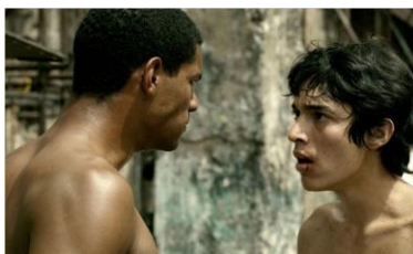
Julio et Daniel

Dans les ordures de Caracas, une mère et son petit garçon Julio découvrent un nouveau-né abandonné. La femme décide d'en prendre soin et de l'appeler Daniel. Devenus grands, Daniel et Julio sont des joueurs de football passionnés et talentueux dans l'équipe de leur barrio , La Ceniza. Ils vont jouer du football en duo, se passent la balle dans le quartier, à l'entraînement comme en compétition. En macho décomplexé, Julio ne cesse de chamberer son frère adoptif, au motif qu'il est encore puceau.