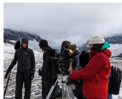
Photo du tournage du film.

Comme le démontre le film, ce panorama naturel est propice à l'introspection et au relativisme. Il pousse les deux personnages du film à s'écouter et à se comprendre.