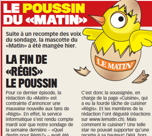
Le Matin, 2010