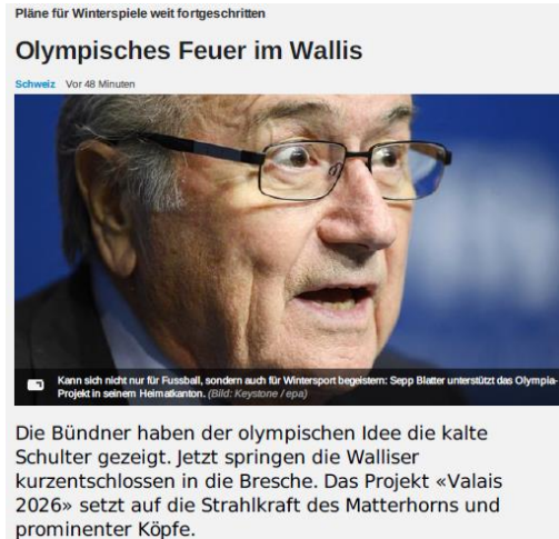
NZZ Online, 2013

ÉCOLES SECONDAIRES Bientôt un manque d'enseignants en Suisse? Une formation rapide permettant aux diplômés du primaire de passer au secondaire pourrait voir le jour en 2011.