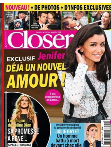
Illustration du titre :

https://www.relay.com/closer/-numero-8688-people-208688-27-annee-2015-page-1.html