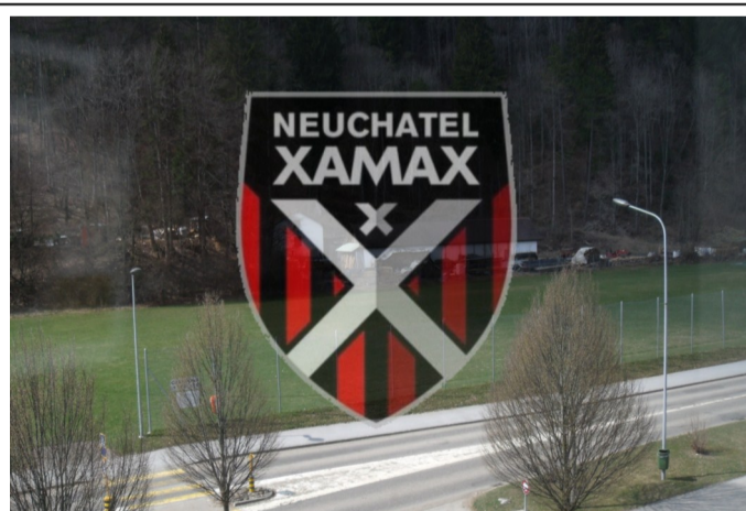
Drapeau de Xamax : www.arcinfo.ch

Suite à la transformation en zoo du stade de la Maladière, les footballeurs se sont exilés sur le terrain des Lerreux à Fleurier mis à disposition par la commune de Val-de-Travers. Ils se sont entraînés hier sous les yeux ébahis des petits Vallonniers.