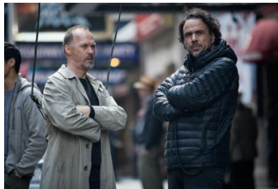
Michael Keaton avec le réalisateur Alejandro González Iñárritu

une destinée profondément humaine, « notre histoire à tous ». Ce personnage à la « Don Quichotte » se trouve en décalage permanent entre ses très sérieuses ambitions et la sordide réalité qui l'entoure. Au cœur de ses préoccupations, l'acteur cherche à retrouver l'amour de soi et donc, par extension celui des autres, bien au-delà des flatteries de la célébrité. Mais l'univers du théâtre dans lequel il fait irruption est autrement exigeant, à tel point que des enjeux démesurés s'y disputent l'espace. Les egos qui s'y entredéchirent font que notre Riggan se demande s'il a bien fait de mettre ainsi en péril son confortable statut de superhéros pour cette quête vers une réhabilitation.