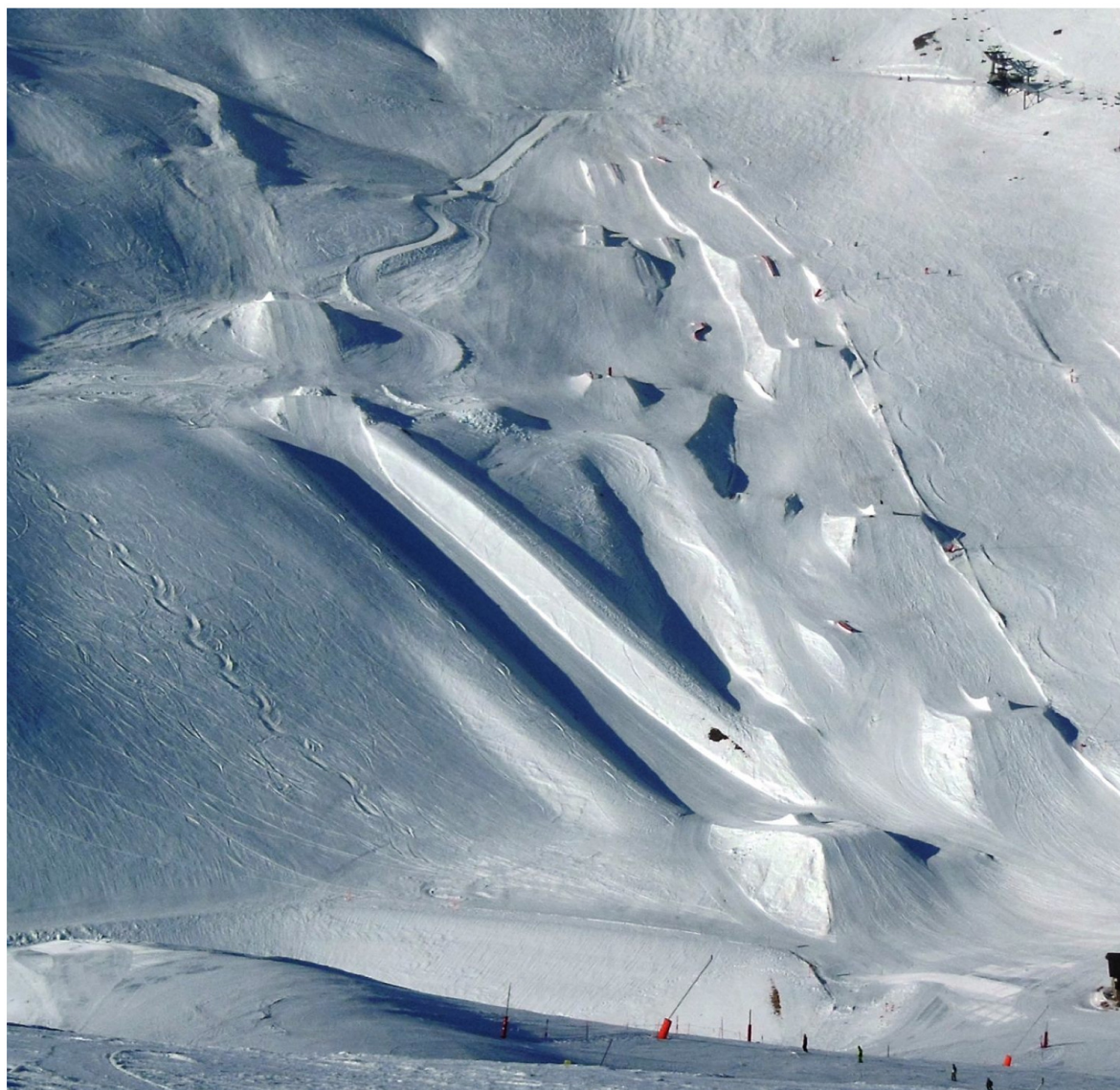
Image du snowpark de Leysin pris de la piste de la Berneuse.