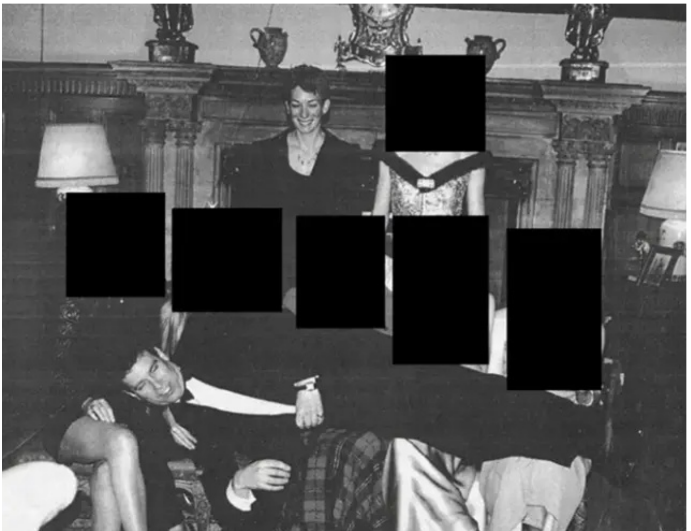
Jeffrey Epstein, se reposant sur les genoux de 5 femmes aux visages censurés