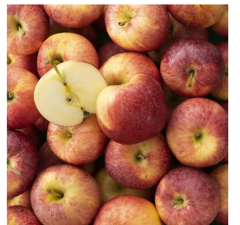
Pommes Gala suisses