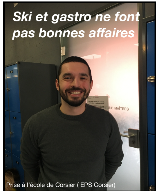
Prise à l'école de Corsier ( EPS Corsier)