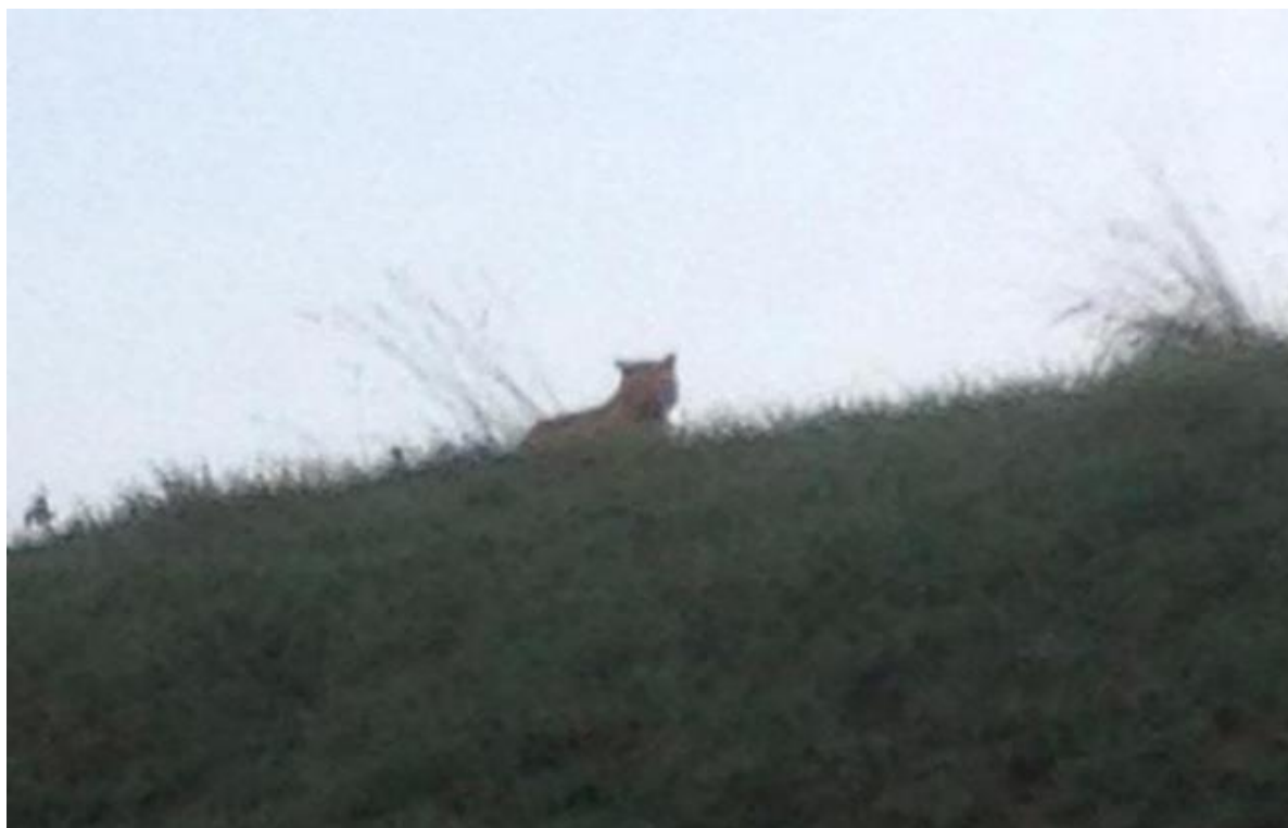
Photo prise par une passante à Montévrain, près de Paris, sur laquelle on distingue un félin en liberté, le 13 novembre 2014