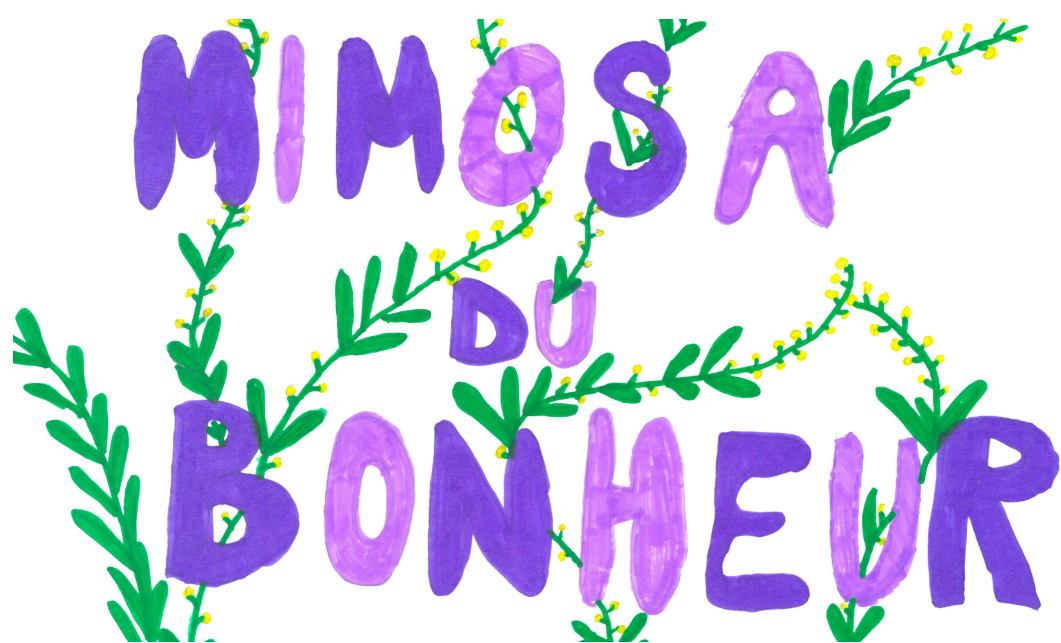
Affiche pour la vente du mimosa par JD

Le 31 janvier, les élèves de 5-6-7P de l'école de Geneveret ont vendu du mimosa à Vicques pour récolter de l'argent pour l'association le Mimosa du bonheur. Le but de cette association est de donner de l'argent aux enfants qui n'ont pas les moyens de faire certaines activités comme une course d'école, un camp de ski ou d'autres activités scolaires. Les élèves ont récolté 1051 francs cette année.