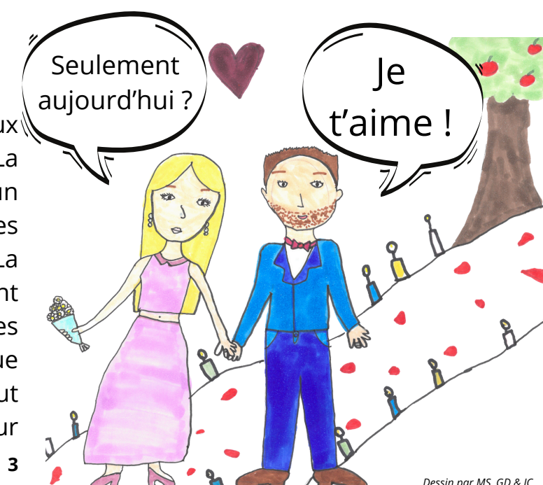
Dessin par MS, GD & JC

Le 14 février, les amoureux fêtent la Saint-Valentin. La légende dit que Valentin, un prêtre, célébraient des mariages alors que c'était interdit. La plupart du temps, les gens vont au restaurant et s'offrent des fleurs qui sont plus chères que d'habitude. Mais est-ce qu'il faut attendre la Saint-Valentin pour s'offrir des cadeaux ?