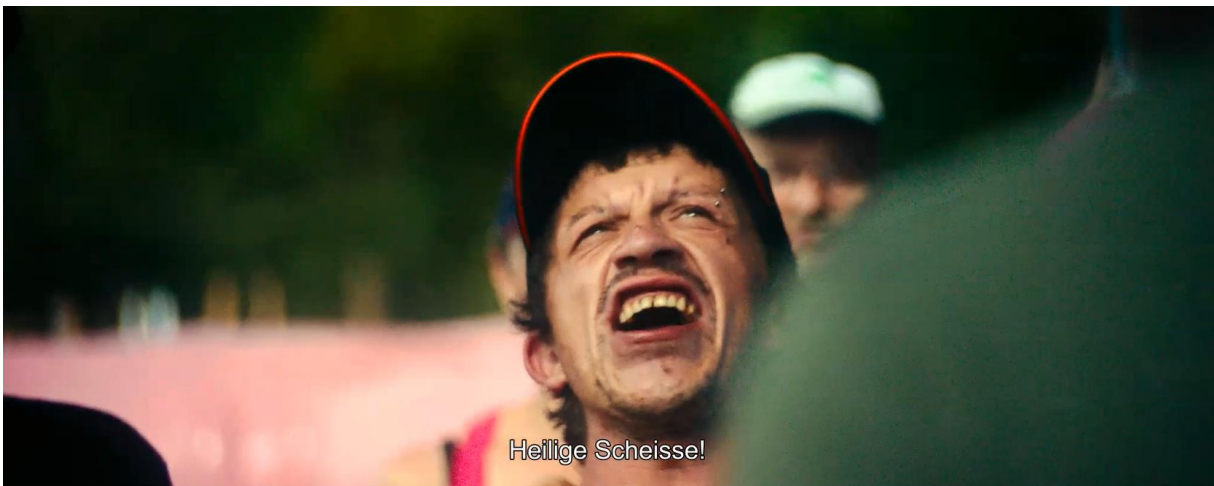
Plan rapproché. Un inconnu hurle le juron qui donne son titre au film : "Vingt dieux !"