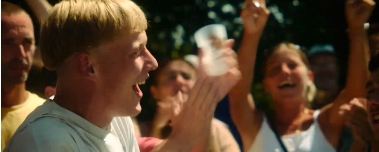
Plan rapproché. Le garçon qui a lancé le défi exprime son bonheur dans la liesse générale.