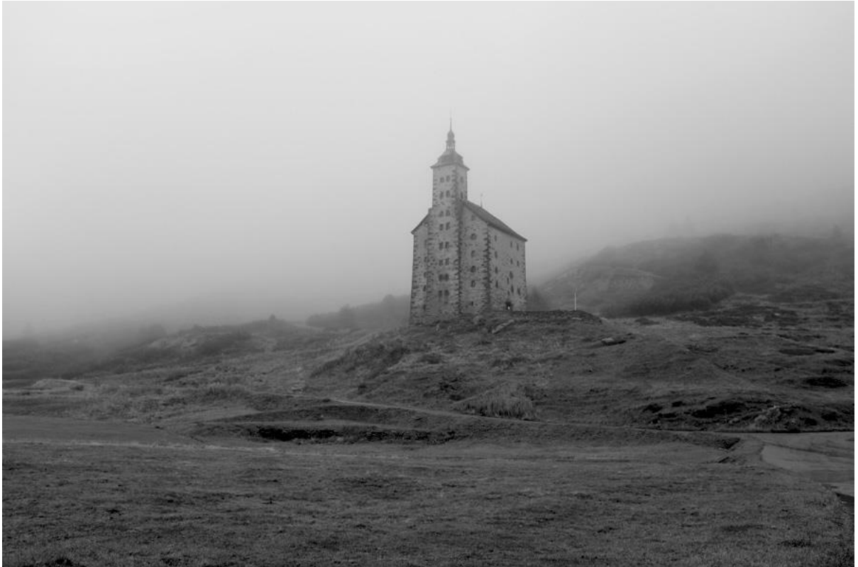
L'Alte Spittel (ou Altes Hospiz, ancien hospice du Simplon)

Richissime homme politique de Brigue, anobli par Louis XIV lors de la Guerre de 30 ans, Kaspar Stockalper (1609-1691) fit construire ce palais en 1666 comme symbole de son pouvoir. Devenu plus tard hospice, le bâtiment a été délaissé au profit d'un nouvel hospice construit non loin de là par Napoléon en 1831. L'Alte Spittel est désormais utilisé par l'armée suisse. 3