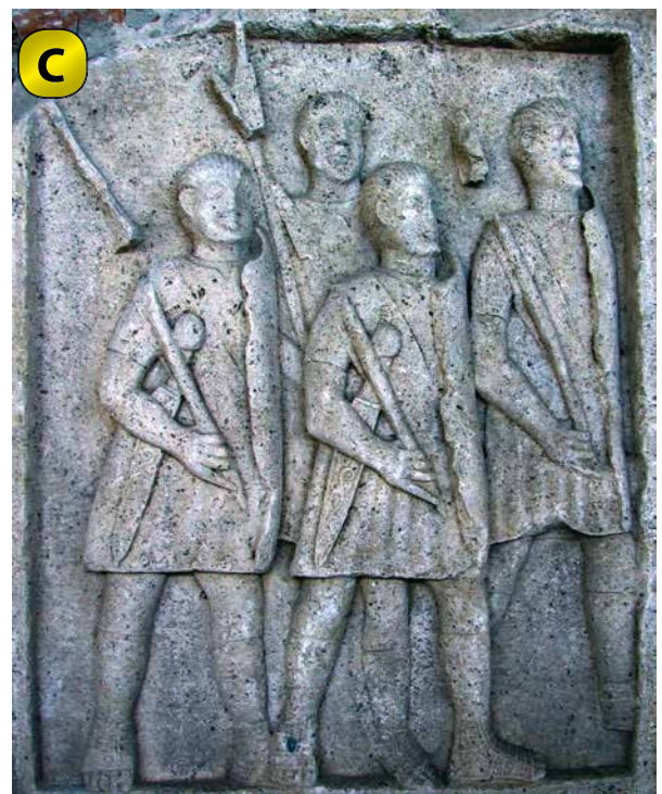
Mausolée, Adamclisi (Roumanie), 107-108 après J.-C.