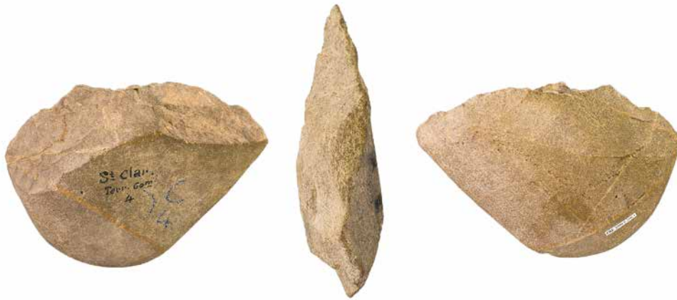
Galet aménag  (vu sous diff rents angles)

Observe cette image. Qu'as-tu envie de savoir ?