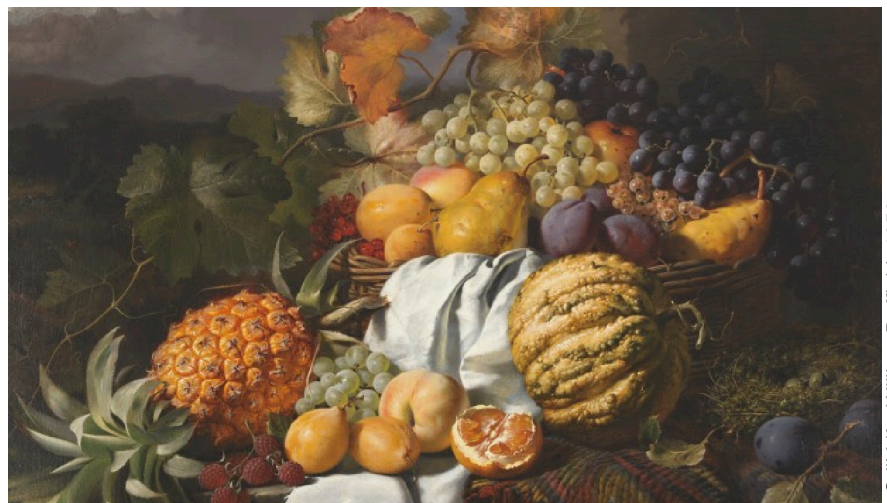
Still Life, William Duffield, 1859