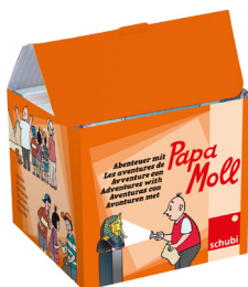
Les aventures de Papa Moll (s.d.). Schubi.