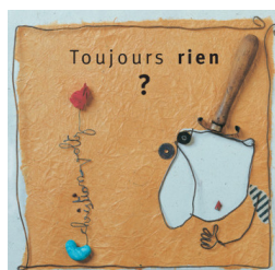
Voltz, C. (1999). Toujours rien? Le Rouergue. (À disposition dans les classes romandes: moyen DEL).