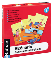
Scénario - suites chronologiques. (s.d.). Nathan.