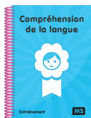
Gourgue, D., Bianco, M., & Coda, M. (2013). Compréhension de la langue . Éditions de la Cigale.