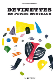
Armellini, C. (2016). Devinettes en petits morceaux . La Joie de lire.