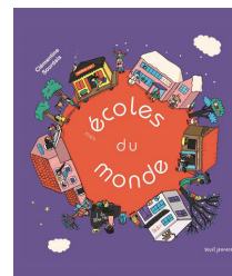
Sourdais, C. (2011). Mes écoles du monde . Seuil Jeunesse.