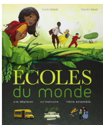
Vidart, E. (2011). Écoles du monde . Flammarion.