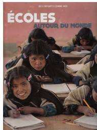
Écoles autour du monde (2015). Gallimard Jeunesse.