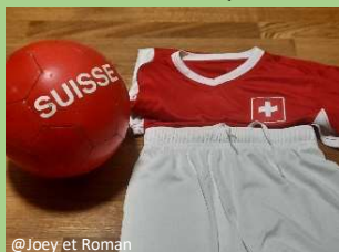
@Joey et Roman

La Suisse a eu raison de la Bulgarie par 4-0, à Lucerne. Cette victoire la qualifie pour la Coupe du monde 2022 au Qatar. P.6