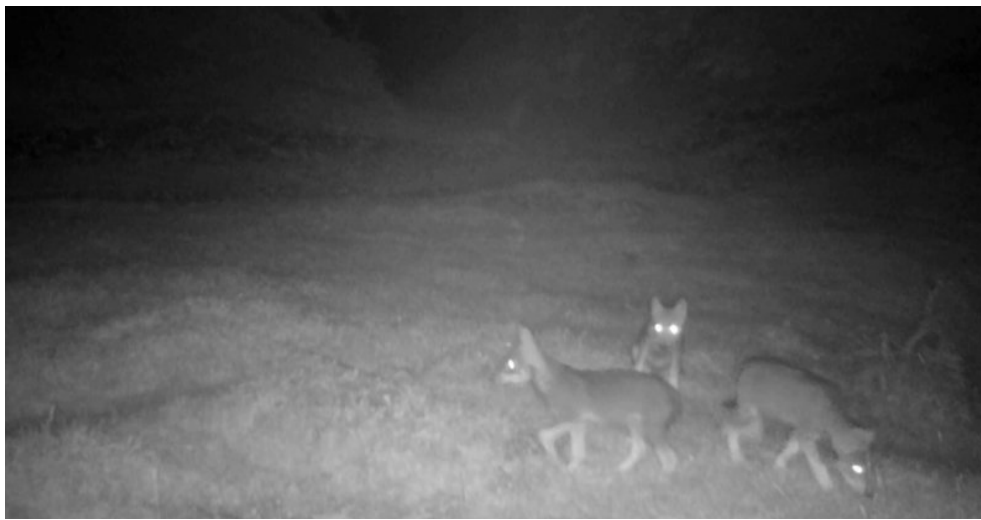
Au Marchairuz en Suisse une meute de loups à attaqué un troupeau de vaches.

https://www.google.com/url?sa=i&url=https%3A%2F%2Fwww.lenouvelliste.ch%2Farticles%2Fsuisse%2Fmarchairuz-la-meute-de-loups-s-agrandit-960112&psig=AOvVaw1hnlQmL4nHdzCJhU3KjaDo&ust=1637744258017000&source=images&cd=vfe&ved=0CAGQjRqFwoTCIjinPuOrvQCFQAAAAAdAAAAABAJ