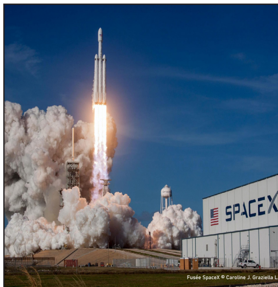
Fusée SpaceX