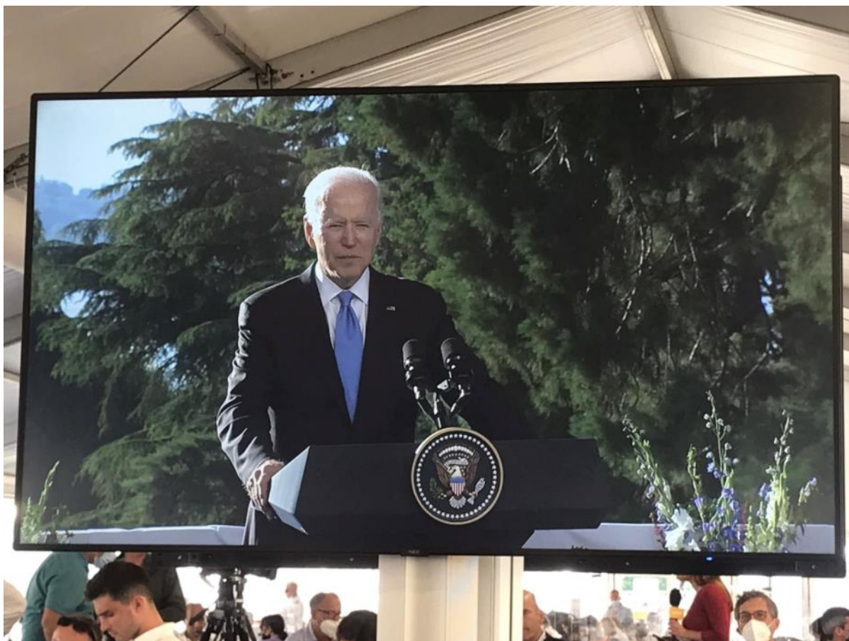
Image e. Conférence de presse de Joe Biden