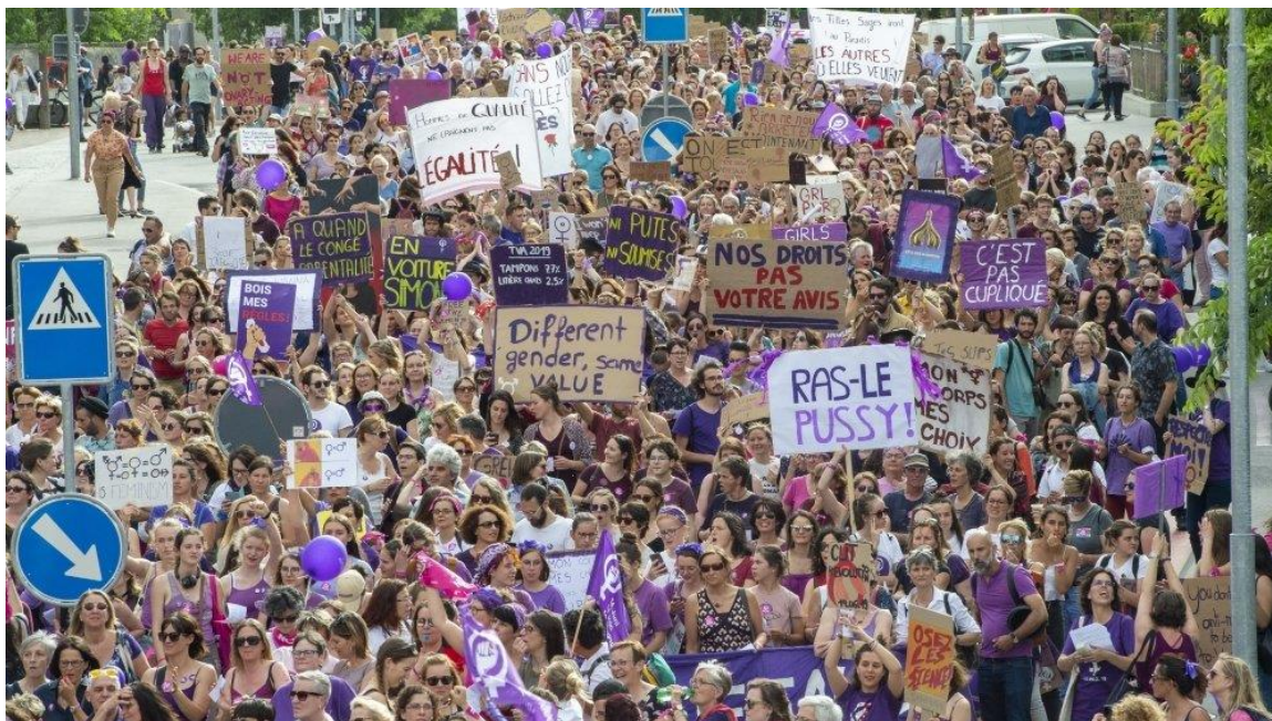
Image a. Grève des femmes en 2019 en Valais

Source : https://www.lenouvelliste.ch/dossiers/femmes-valais/articles/greve-des-femmes-la-vague-violette-n-a-pas-emporte-les-inegalites-945975