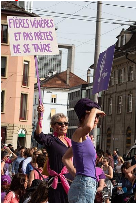
Image b. Grève des femmes à Bienne

Source : https://www.lenouvelliste.ch/dossiers/femmes-valais/articles/greve-des-femmes-la-vague-violette-n-a-pas-emporte-les-inegalites-945975