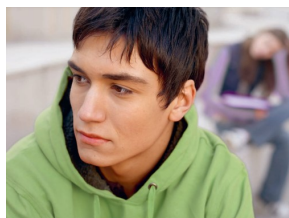
GUIDE CRITÈRES DE BONNES PRATIQUES PRÉVENTION DE LA VIOLENCE JUVÉNILE