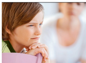
PRÉVENTION DE LA VIOLENCE ÉTAT ACTUEL DU SAVOIR SUR L'EFFICACITÉ DES APPROCHES