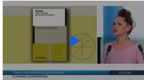
États-Unis : Harlem, une histoire de la "gentrification"