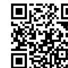
Schéma interactif permettant de découvrir les principales voies de formation en Suisse, notamment la formation professionnelle initiale et les écoles d'enseignement général.

formationprof.ch Le portail de la formation professionnelle