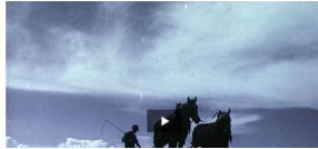
Le plan Wahlen