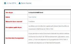
Le krach de Wall Street

Type documentaire : Source : Le petit journal des profs Liens PER : SHS 32 Utilisateurs finaux : Apprenants, Enseignants Mots clé : XXe siècle, crise, prospérité, Krach, Wall Street, bourse, actions, spéculation, investissements