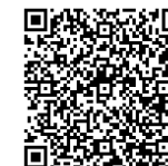
Tableau destiné à l'enseignant permettant de comparer trois grands systèmes économiques et sociaux : communisme, socialisme, capitalisme. Utile pour l'ensemble des thèmes consacrés au XXe siècle.

Mots clé : XXe siècle, crise, prospérité, économie, société, communisme, socialisme, capitalisme