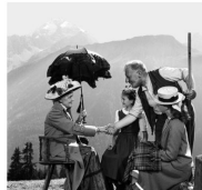
© Universal Ullstein, Bernese Alps / Universal Images Group Maintes fois rééditées et traduites dans plus de cinquante langues, les récits de Johanna Spyri, Heidi (1882, all. 1880) et Heidi grandit (1882, all. 1881), font partie des histoires les plus célèbres pour enfants en Suisse et dans le monde. Le personnage de H.