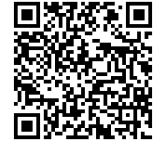
11 08 17 Albert Anker Version de 03/03/2017

« Le vrai Suisse ne peut être que montagnard. C'est donc toute l'histoire helvétique qui se trouve réinterprétée sous l'éclairage d'un imaginaire historique et topographique spécifique. Bergers et montagne deviennent des éléments constitutifs de l'identité helvétique, comme on le constate avec Heidi, l'héroïne de Johanna Spyri. » Tiré du site.