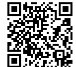
CC BY 11 Albert Anker

« En 1917, une grande rétrospective au Kunsthaus de Zurich présenta son œuvre foisonnante, qui comprend des portraits, des paysages (notamment de haute montagne), des figures et des peintures murales. » Tiré du site.