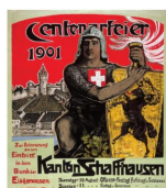
Illustration: Gary Hall | Université Pierre & Marie Curie La célébration de fêtes commémoratives contribua à la formation d'une conscience nationale moderne et au processus de construction de la nation. Contrairement à la commémoration de batailles de l'ancienne Confédération, dont elles s'inspiraient, les fêtes modernes étaient de portée nationale et non locale, elles