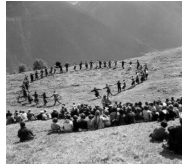
Parmi les formes typiques, on s'intéresse aux mouvements stylisés (cortèges, danse, contacts physiques, coups), aux épreuves et spectacles (concours de force, théâtre, jeux), aux masques et mimiques, aux quêtes et dons, aux repas et banquets (Manières de table). Ou