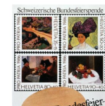
La fête nationale du Premier août se réfère au Pacte de 1291 (Pactes fédéraux), mais elle n'est célébrée que depuis 1891, ce qui s'explique par deux raisons principales. D'une part, on plaça jusqu'au XIXe s. la fondation de la Confédération au 8 novembre 1307, date du serment du Grütli selon Aegidius Tschudi. Le