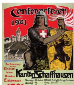
Illustration de la célébration de fêtes commémoratives contribua à la formation d'une conscience nationale moderne et au processus de construction de la nation. Contrairement à la commémoration de batailles de l'ancienne Confédération, dont elles s'inspiraient, les fêtes modernes étaient de portée nationale et non locale, elles