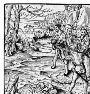
Illustration de Peter Koller Paris et Genève Les récits relatifs à la fondation de la Confédération apparaissent dans les sources écrites au XV e s. Ils appartiennent au genre littéraire des légendes et ont des traditions locales et motifs narratifs de diverses origines. L'histoire de Guillaume