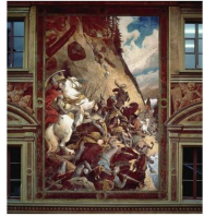
Plus que l'événement lui-même, c'est la signification centrale qu'on lui a donnée ultérieurement dans l'histoire de la Confédération qui est importante. A la fin du Moyen Âge, on organisait des commémorations religieuses de portée locale (Commemoration de batailles), Aux XIX e