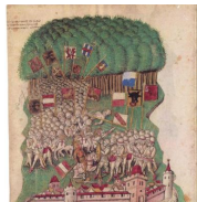
Après l'acquisition du Tyrol en 1273 et le partage des biens habsbourgeois en 1279, le duc Léopold III de Habsbourg s'efforça très activement de créer une liaison directe entre les pays autrichiens et le Tyrol, notamment en prenant en gage Nidau, Bären et Altdorf (liaison avec Fribourg en