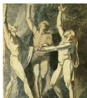
Au milieu du XVI e s., une tradition iconographique des Trois Suisses, dont la popularité n'atteignit cependant jamais celle de la figure de Guillaume Tell, vint compléter les légendes orales et écrites. L'œuvre la plus célèbre demeure le tableau du Serment du Grütli de Johann Heinrich Füssli (1779).