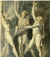
Au milieu du XVI e s., une tradition iconographique des Trois Suisses, dont la popularité n'atteignit cependant jamais celle de la figure de Guillaume Tell, vint compléter les légendes orales et écrites. L'œuvre la plus célèbre demeure le tableau du Serment du Grütli de Johann Heinrich Füssli (1779).