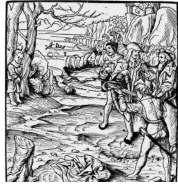
Illustration de Peter Koenig Les récits relatifs à la fondation de la Confédération apparaissent dans les sources écrites au XV e . Ils appartiennent au genre littéraire des légendes et ont des traditions locales et motifs narratifs de diverses origines. L'histoire de Guillaume