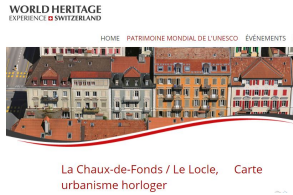
La Chaux-de-Fonds / Le Locle, Carte urbanisme horloger