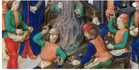
Fabriquer une monnaie