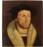
Portrait à l'âge de 22 ans. Bullinger fut bien attiré en jeune ministre de Dieu après Christenbühlstrasse Zürich.