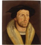
Portrait à l'âge de 22 ans. Bullinger fut bien attiré en jeune ministre de Dieu après Christenbühlische Zürich.