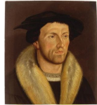
Portrait à l'âge de 22 ans. Bullinger fut brièvement un prêtre catholique dans sa ville natale de Bâle.