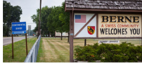
La Suisse hors de ses frontières