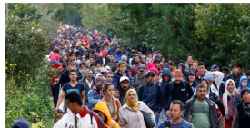
Quotas de migrants : la Slovaquie et la Hongrie déboutées par la justice européenne